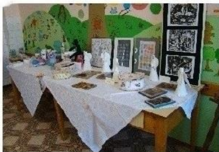
Pracownia terapii zajęciowej

Dom Pomocy Społecznej im. L. i A. Helclów - miejsce wielu możliwości działania dla wolontariuszy